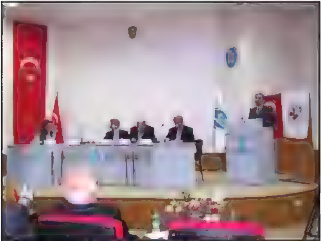
Üçüncü Oturum – Türkiye Orta Doğu